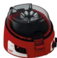
CAPP Rondo Microcentrifuga Codice: KNCR68X

Microcentrifuga con velocità programmabile fino a 6000 rpm/2000G e timer.