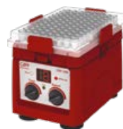
CAPP Rondo Plate Shaker Codice: KNCRP18X

Agitatore per micropietra con un ingombro minimo, controllato da microprocessore, stabile, silenzioso