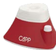
Capp Rondo Vortex Mixer 4500 rpm Codice: KNCRV45X

Mini Vortex per una miscelazione accurata e un rapido vortex. Movimento orbitale di 4,5 mm, velocità fino a 4500 rpm/min, per provette fino a 30 mm di diametro. I Velocità regolabile.